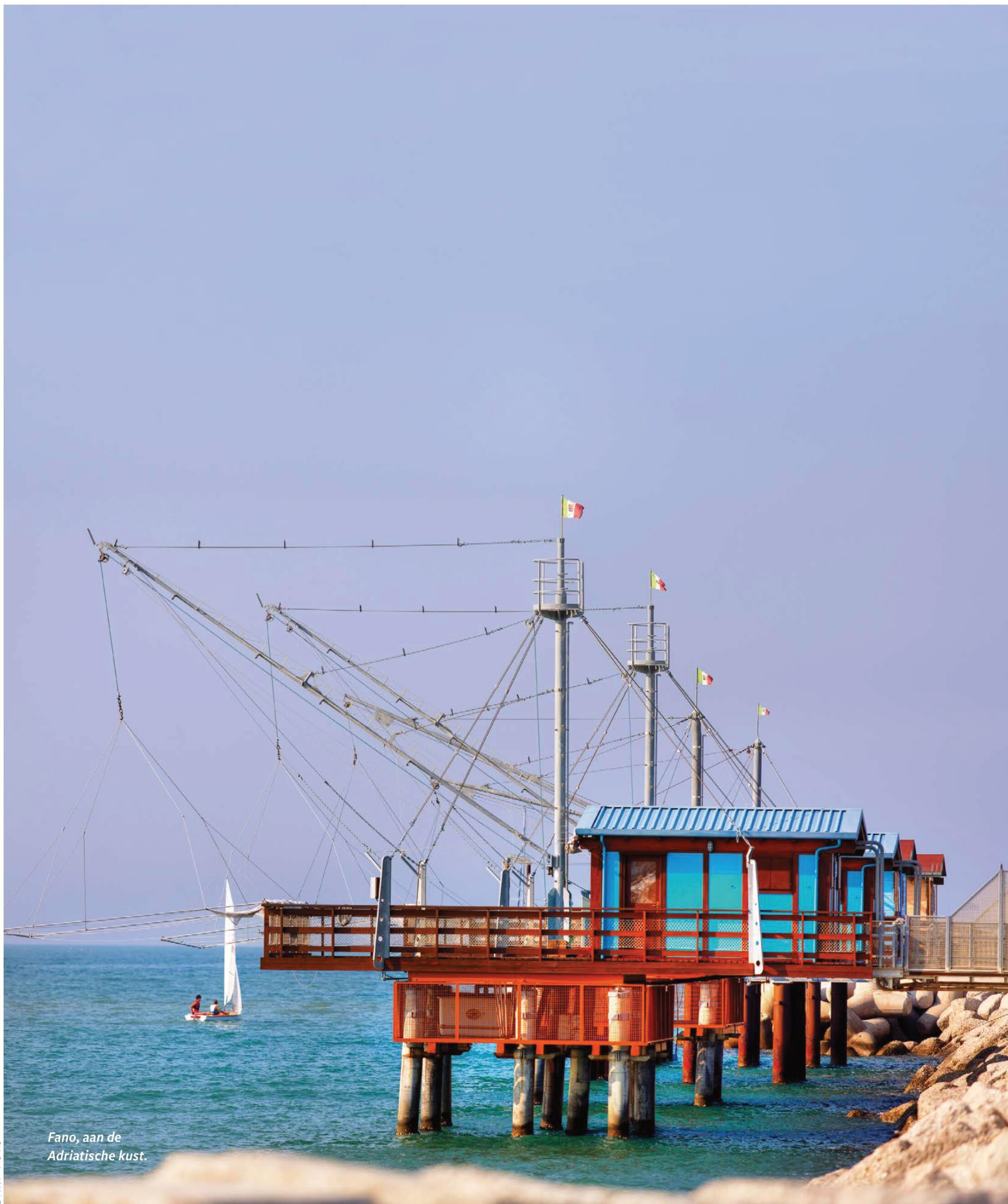
Fano, aan de Adriatische kust.