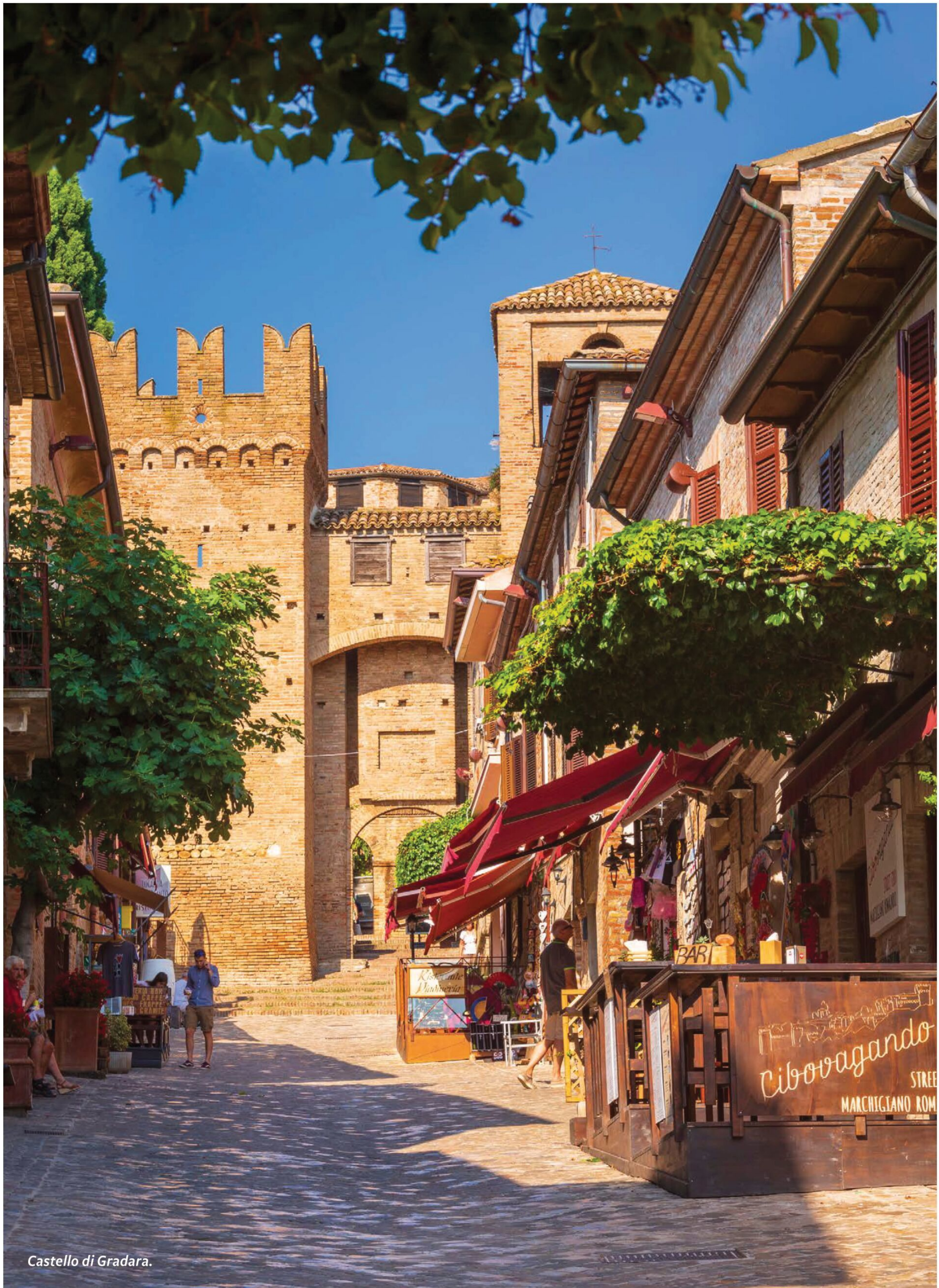
Castello di Gradara.